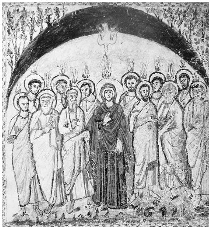
Šventosios Dvasios atsiuntimas. Rabulos evangelyno miniatiūros fragmentas. 586 m. Florencija, Šv. Lauryno biblioteka

Sirų krikščionys ir iki šių dienų yra susiskaide. Katalikiškų siriškų Bažnyčių gimimas (chaldėjų, sirų katalikų, melkitų) suteikė progą atrasti ir įtraukti siriškąsias doktrinas į bendrąjį tikėjimą, tačiau tuo pat