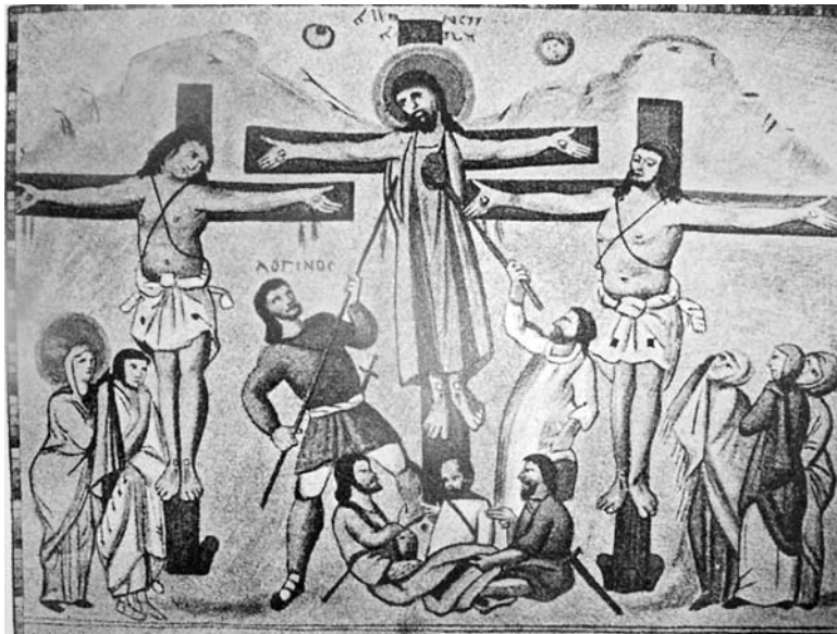
Nukryžiuojimas. Rabulos evangelyno miniatiūra. 586 m. Florencija, Šv. Lauryno biblioteka

Apie III a. vidurį Rytų krikščionys imti persekioti dėl konfliktų tarp naujojo mazdėjizmo ir manichėjizmo. Manis (216–277) gimė šalia Seleukijos-Ktesifonto. Praleidęs apie dvidešimt metų vienoje judėjų-krikščionių