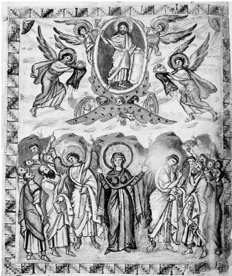
Kristaus žengimas į dangų. Rabulos evangelyno miniatiūra. 586 m. Florencija, Šv. Lauryno biblioteka

Nors Persijos Bažnyčia įgijo institucinę nepriklausomybę taikiu keliu, dogminis atsiskyrimas toks toli gražu nebuvo. Dogminės kontroversijos, išiplieskusios Bizantijos teritorijoje, draskė krikščionis sirus taip, kaip istorijoje dar nebuvo regėta. Graikų-romėnų pasaulyje kristologinės doktrinos greitai perėmė naujas formuluotes, kurioms pamatus padėjo du ekumeniniai susirinkimai: Efezo ir Chalkedono. Žvilgsnis į įvairius šios istorijos epizodus mums suteiks galimybę geriau suprasti, kaip Rytų ir